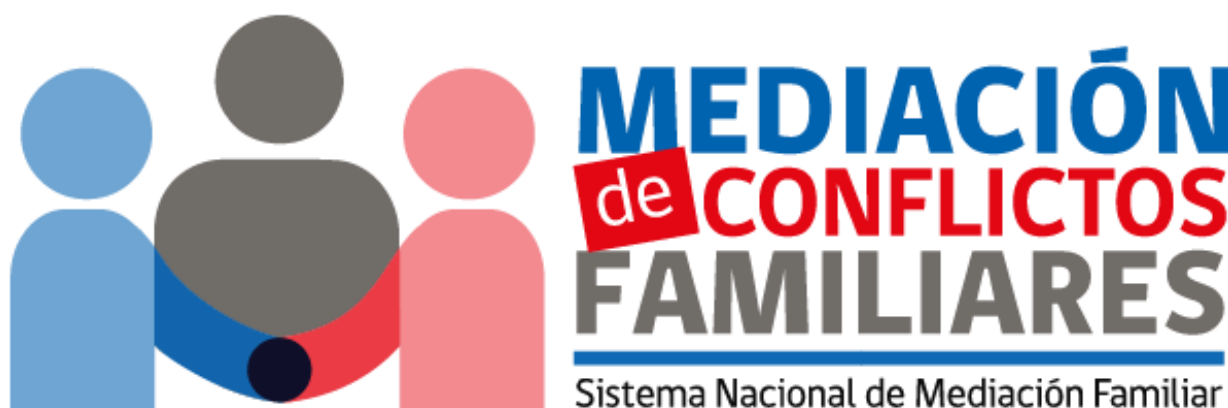
Logotipo Servicio Nacional de Mediación, MINJUDDHH

Durante el mes de junio y comienzos de julio, fueron compartidos los resultados del “Estudio de costo-eficiencia del Programa licitaciones del sistema nacional de mediación” desarrollado por la Unidad de Investigación y Coordinación en coordinación con la Unidad de Mediación, ambos pertenecientes a la Subsecretaría de Justicia. El estudio es un compromiso adquirido para dar respuesta a las recomendaciones emitidas por un panel de expertos en el marco de las Evaluaciones de Programas Gubernamentales (EPG) que realiza la Dirección de Presupuestos (DIPRES) del Ministerio de Hacienda. Es indudable que los desafíos de ajustar un servicio de Mediación Familiar adecuado a lo que requiere la ciudadanía, es un proceso de continuo desarrollo.