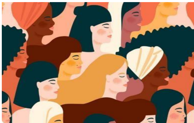
Fotografía referencial género femenino