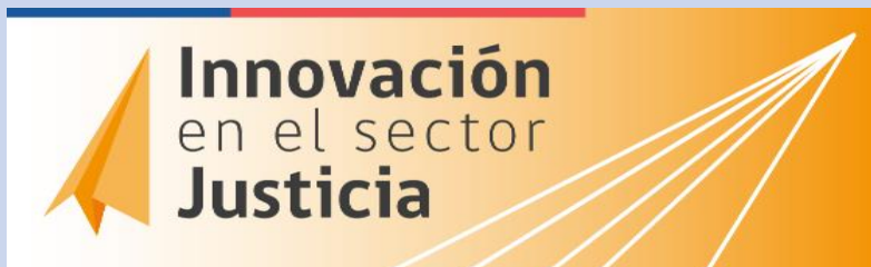
Logotipo oficial Innovación MINJUDHH