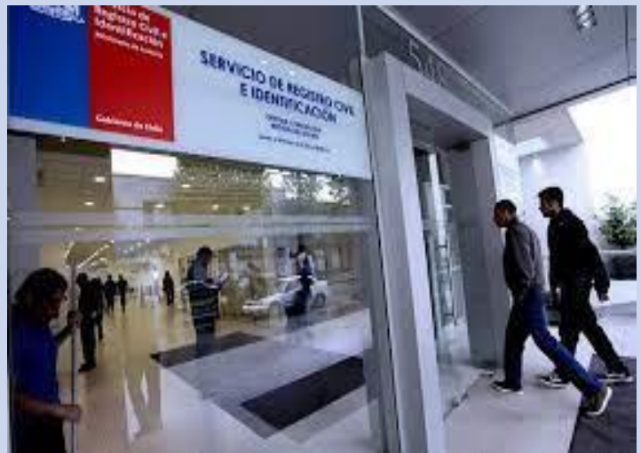
Fotografía referencial oficinas RCEI

Durante el mes de septiembre, se realizó el levantamiento correspondiente al estudio del Índice de Satisfacción Neta del Servicio de Registro Civil e Identificación, que este año fue adjudicado mediante licitación pública a STATCOM DATAVOZ.